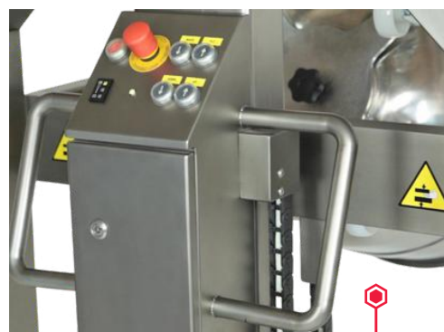
Panneau de commandes simplifié