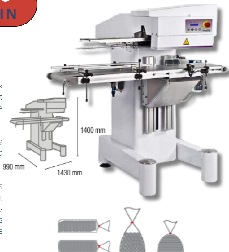
TYPE DE SACHET PRIS EN CHARGE